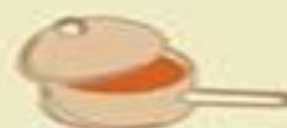
Virti kiaušinius morkų sultyse