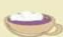
Užpildti vandeniu ir užmerkti 3 valandom