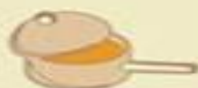
Užpildti vandeniu ir užmerkti 3 valandom