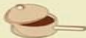
Virti kiaušinius ir kavą 250 ml vandens