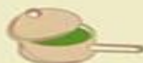
Virti kiaušinius špinatų sultyse