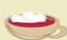
Užmerkti 3 valandom