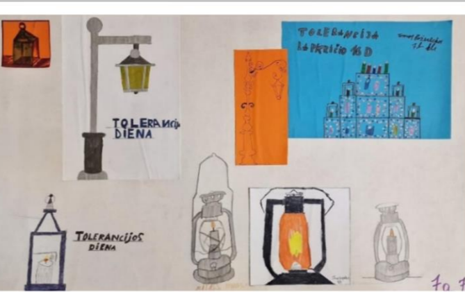
Tolerantiškos aplinkos siekimas gimnazijoje per įvairias kūrybines veiklas, dalyvaujant tolerancijos dienoje.