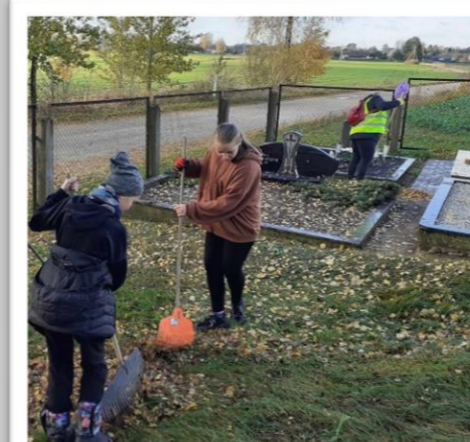
Aktyvus įsitraukimas į kasmetinę miestelio kapų tvarkymo akciją „Te nelieka užmirštų kapų“.