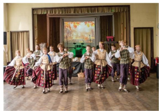
Dalyvavimas renginiuose, liaudiškų šokių šventėse.