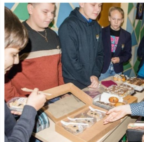
Akcija „Pyragų diena“.