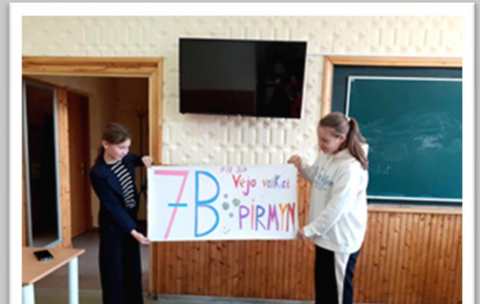
Klasės ir gimnazijos atstovavimas įvairiuose renginiuose, iššūkiuose.