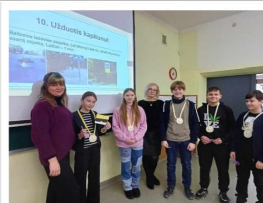
Siekimas aukščiausių rezultatų įvairiuose konkursuose.